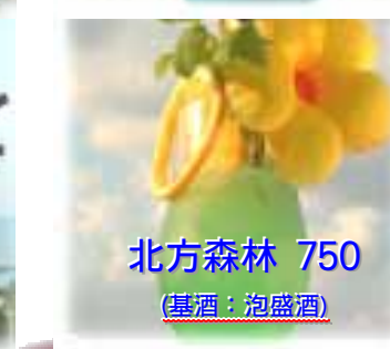
北方森林 750 (基酒: 泡盛酒)