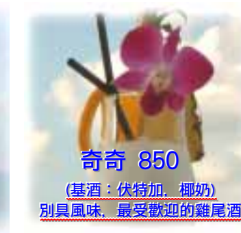
奇奇 850 (基酒: 伏特加, 椰奶) 別具風味, 最受歡迎的雞尾酒