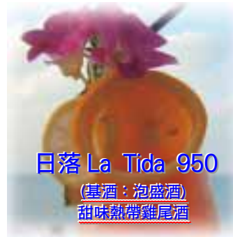
日落 La Tida 950 (基酒: 泡盛酒) 甜味熱帶雞尾酒