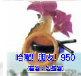
哈囉! 朋友! 950 (基酒: 泡盛酒)