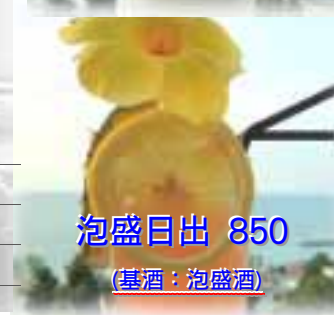
泡盛日出 850 (基酒: 泡盛酒)