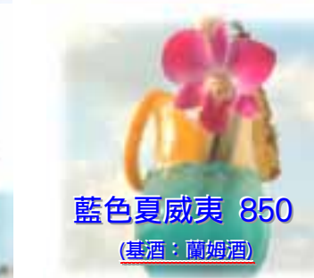
藍色夏威夷 850 (基酒: 蘭姆酒)