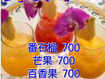
番石榴 700 芒果 700 百香果 700