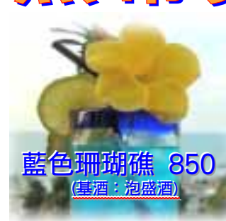
藍色珊瑚礁 850 (基酒: 泡盛酒)