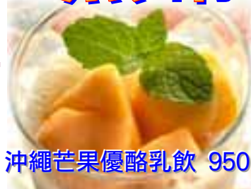
沖繩芒果優酪乳飲 950