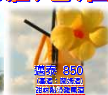
邁泰 850 (基酒: 蘭姆酒) 甜味熱帶雞尾酒